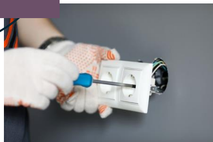
Nya eluttag installeras