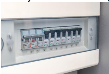
En ny elcentral monteras i lägenheten