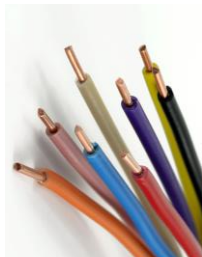
Alla ledningar i lägenheten byts ut