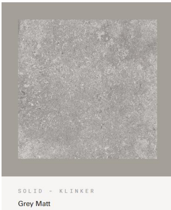
Figur 1 Klinker