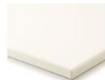
Figur 2 Köksslucka