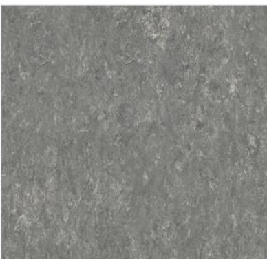
Figur 5 Linoleummatta